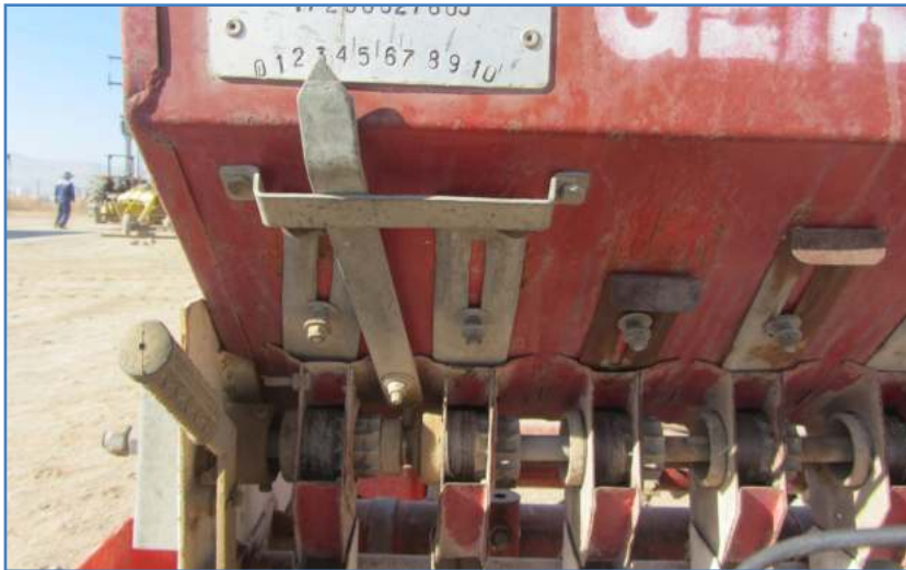
شکل ۴- اهرم تنظیم بذر در دو نوع بذرکار

معمولاً راهنمای اهرم تنظیم با توجه به مقدار بذر در هر هکتار، توسط جداولی از طرف سازنده ارائه شده است. همچنین میزان بازبودن زبانه خروجی موزع می بایست تنظیم شود (شکل ۵). برای بذور دانه ریز، دهانه دریچه خروجی موزع می بایست بر روی کم ترین مقدار باشد. برای گندم و جو میزان بازشدگی