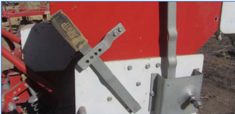
شکل ۵- اهرم تنظیم میزان بازبودن دریچه خروجی موزع در دو نوع بذرکار

ابتدا محیط چرخ را اندازه‌گیری می‌کنیم. این کار را می‌توان با استفاده از نوارهای فلزی یا پلاستیکی انجام داد (شکل ۶).