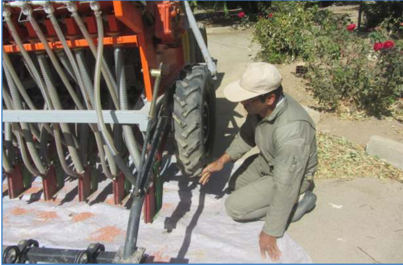
شکل ۹- چرخش چرخ به تعداد ۲۰ دور

در صورتی که چرخ محرک را ۲۰ دور بچرخانیم، با استفاده از رابطه ۱، می‌توان مقدار بذر ریخته شده داخل سینی یا پارچه برزنتی را محاسبه کرد.