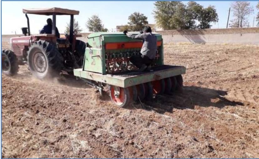
شکل ۱۱- خطی کار مخصوص دیم (نیروی لازم برای چرخش موزع از طریق چرخ فشار تأمین می‌شود)

نیروی از طریق زنجیر و جعبه دنده به محور موزع انتقال می‌یابد. واسنجی این نوع دستگاه‌ها به روش مزرعه‌ای، مشابه واسنجی کارنده آبی است و به دیم‌کاران پیشنهاد می‌شود از این روش استفاده کنند. مثال زیر روش واسنجی دیم‌کار به روش مزرعه‌ای را بیان می‌کند.