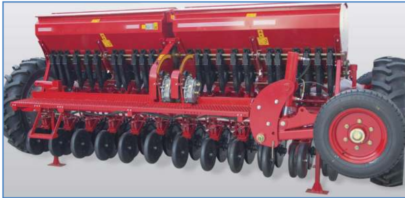
شکل ۲- خطی کار چرخ‌گرد