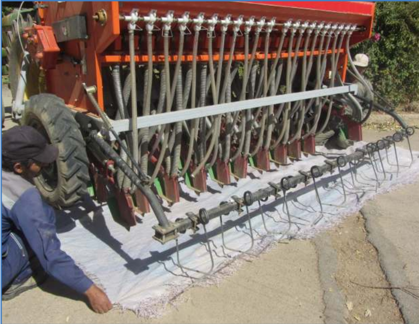
شکل ۸- استفاده از پارچه برزنتی یا پلاستیکی در صورت نبود سینی مخصوص واسنجی

بعد از آن سینی مخصوص واسنجی را در قسمت زیر موزع‌ها قرار می‌دهیم. اگر سینی مخصوص در اختیار نباشد، می‌توان از یک پارچه برزنتی یا یک نایلون ضخیم استفاده کرد (شکل ۸).