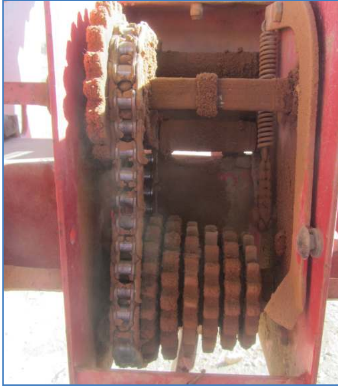
شکل ۱۳- با جابه‌جا کردن چرخ دنده‌ها می‌توان تراکم دلخواه را به دست آورد.

در صورتی که این تعداد بذر حاصل نشود، با تغییر چرخ دنده می‌توان تراکم مدنظر را به دست آورد (شکل ۱۳).