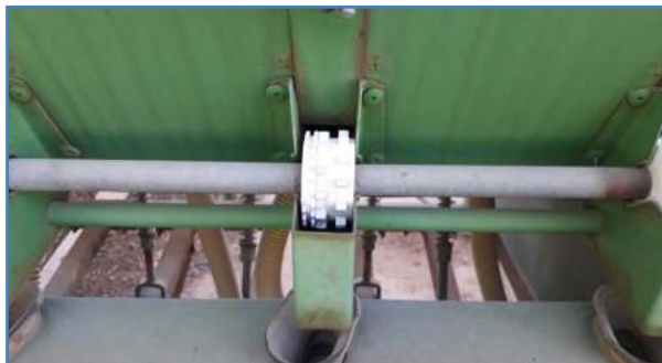
شکل ۱- موزع مخصوص غلات (بالا) و موزع مخصوص ریزدانه (پایین)