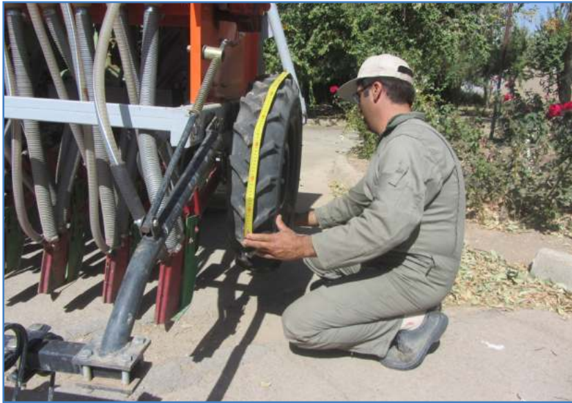
شکل ۶- اندازه‌گیری محیط یا درو چرخ بذرکار

عرض ماشین را اندازه‌گیری می‌کنیم. برای اندازه‌گیری عرض ماشین کافی است تعداد واحدهای کارنده را در فاصله بین دو کارنده ضرب کنیم (شکل ۷). روش دیگر این است که با استفاده از یک متر فلزی، فاصله شیاربازکن اولی و انتهایی را اندازه گرفت و مقدار به‌دست آمده را با فاصله بین دو شیاربازکن جمع کرد.