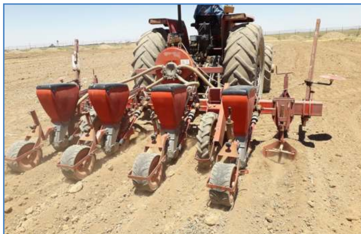
شکل ۱۲- ردیف‌کار برای کشت ذرت، لوبیا و...

روش واسنجی ردیف‌کارهای پنوماتیک و مکانیکی مشابه است. نوع پنوماتیکی آن در بین کشاورزان بیش تر رایج است (شکل ۱۲). در کشت ردیفی، تراکم را معمولاً برحسب تعداد بوته در هر هکتار بیان می‌کنند. مثلاً برای ذرت ۹۰,۰۰۰ تا ۱۱۰,۰۰۰ بوته در هکتار توصیه می‌شود. گاهی نیز بر اساس فاصله بذر طولی بیان می‌شود. در کشت ردیفی بین دو پشته معمولاً ۶۰ تا ۷۵ سانتی متر است. روش کشت معمولاً به صورت ۲ ردیف بر روی پشته یا یک ردیف بر روی پشته است، که روش کالیبراسیون برای هر نوع الگوی کشت توضیح داده می‌شود. نکته اینکه در اینجا روش کارگاهی توضیح داده شده است.