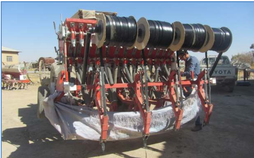
شکل ۱۰- استفاده پارچه کتان یا پلاستیک به منظور کالیبراسیون بذر کار محور گرد

سینی بذر را بر روی دستگاه نصب می‌کنیم. در صورت نبود سینی بذر، یک پارچه برزنتی یا پلاستیکی را که کمی بزرگ‌تر از عرض کار بذرکار باشد، انتخاب می‌کنیم (شکل ۱۰).