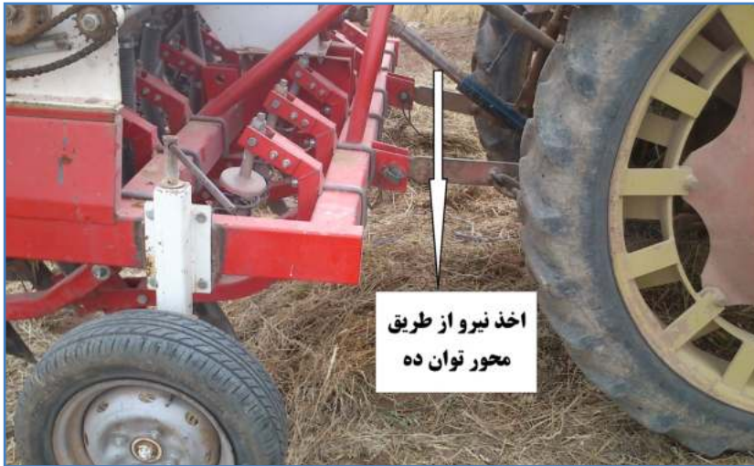
شکل ۳- خطی کار محور گرد: قابلیت کشت در شرایط آبی و دیم