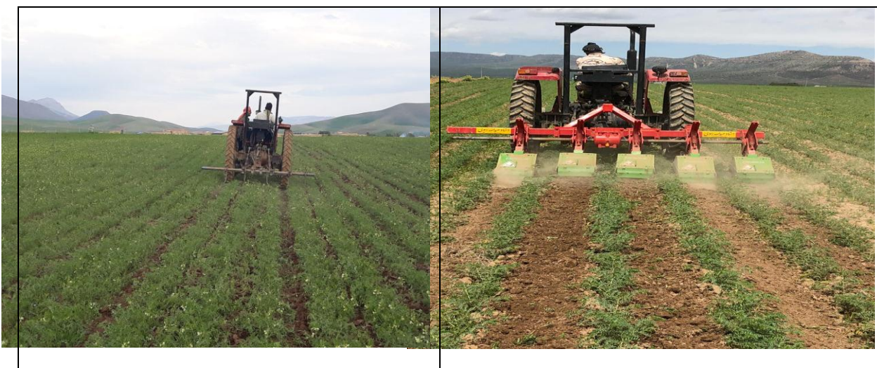
شکل ۱) کنترل مکانیکی علف‌های هرز مزرعه نخود با استفاده از کولتیواتور با ایجاد فاصله بین ردیف ۷۰ سانتیمتر (سمت راست) و ۵۰ سانتیمتر (سمت چپ)

۳-۲-۲- کنترل شیمیایی: با استفاده از علفکش انتخابی سوپر گالانت (۱ لیتر در هکتار) یا گالانت (۲ لیتر در هکتار) می‌توان علف‌های هرز نازک برگ مزارع نخود را کنترل کرد. برای مبارزه با علف‌های هرز پهن‌برگ یکساله در مزارع نخود، استفاده از علفکش انتخابی لتاگران (به میزان ۳/۵ - ۲/۵ لیتر در هکتار) توصیه می‌گردد. زمان سمپاشی باید در اوایل رشد (مرحله ۳-۴ برگگی) علف‌های هرز باشد.